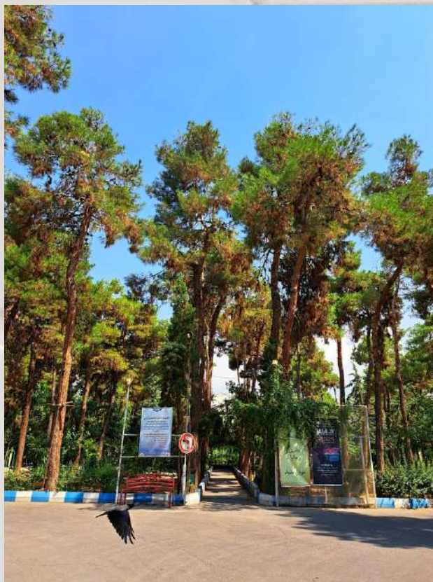
نمای ورودی دانشکده

همیشه اولین‌ها قشنگن، کمتر زمانی پیش میاد اولینی تو دل برو و جذاب نباشه که براش ذوق زده نباشی! همینکه نمیدونی قراره چی پیش بیاد و چجوری غافل گیر بشی هم خودش قشنگه... به عمق ماجرا که دقت کنی سراسر شور و شعف می شی؛ اینایی که گفتیم کم و بیش به دانشگاه هم مربوطه! همه ما بعد از قبولی در دانشگاه علوم پزشکی ایران هیجان اینو داشتیم که بیایم دانشگاه و به قول فردوسی بزرگ " میاسای از آموختن، یک زمان / ز دانش میفکن، دل اندر گمان " اتفاقاً همین دانشگاهه که به عنوان بستر فرهنگی کوله باری از تجربه رو برامون به ارمغان میاره. باور کنید... نوبتی هم که باشه نوبت معرفی کامل و جامع دانشکده توانبخشی ایرانه. موقعیت و شکل فیزیکی دانشکده، نمادی از شش ضلعی غیر منظمیه که بهش میگیم "هگزگون"؛ که تو هر ضلع و گوشه ی اون داستانی نهفته که در ادامه براتون خواهم گفت. میدون مادر محله میرداماد و خیابون سرسبز مددکاران برای ما دانشجویها، مسیر منتهی به توانبخشی ایرانه. بعد از نشون دادن کارت دانشجویی و عبور از مرحله نگهبانی دانشکده، اولین چیزی که به چشم میاد محوطه ای با درختان کاج سر به فلک کشیده ست که روزگار درازی رو گذرونده و شاید بشه گفت پیرترین عضو دانشکده ما هستن که گذر نسل ها رو با چشمشون دیدن. اگر کمی جلوتر بریم، حوض شش ضلعی پر آبی رو میبینیم که برای ما دانشجویها نماد پاکی و زلالی و درخششه! در این اطراف هم نیمکت هایی دیده میشن که در طول روز محلی برای فراغت و استراحتند که اندر احوالات روزها، هیچ دانشجوی بی دغدغه ای رو پیدا نمی کنیم و هر کس به نحوی مشغول کار خودشه.