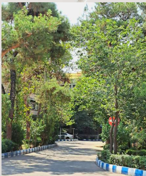
نمایی از محوطه دانشکده