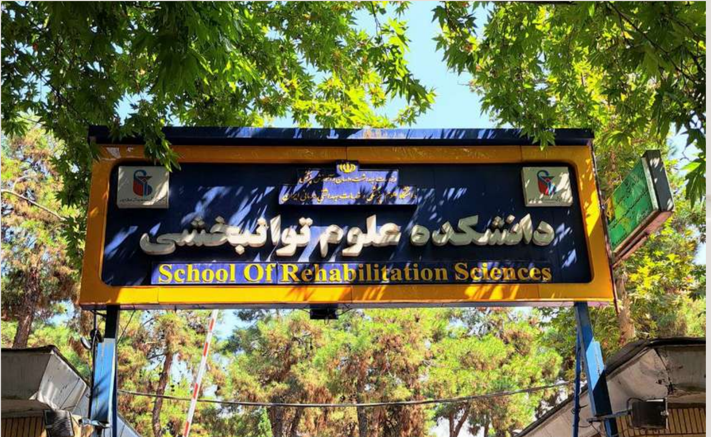
تصویر سر در ورودی دانشکده توانبخشی ایران