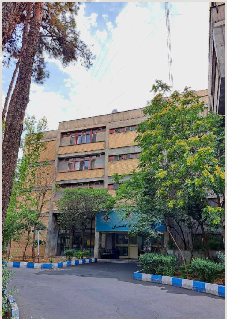
نمای خوابگاه گلستان