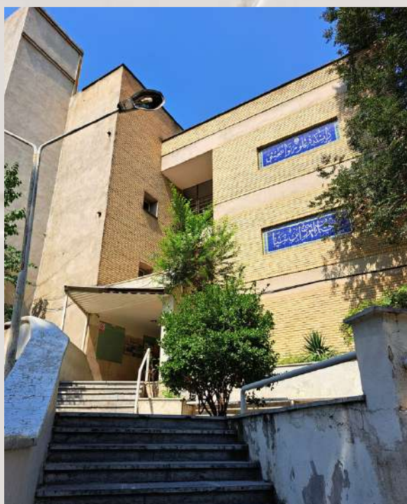
نمای ساختمان ابن سینا

در ادامه، مسیرت بستگی داره به اینکه کلاس داری یا کلینیک : اگه جزو افرادی هستی که کلاس داری، باید راه ساختمان سه طبقه ی ابن سینا رو در پیش بگیری. ساختمونی که تقریباً دو سال اول خیلی تو اون رفت و آمد داری. پله ها رو که بالا میری و وارد ساختمان میشی، روبروت دفتر سرپرستی دروس رو می بینی و چندین کلاس. اگر کلاست تو طبقه دو یا سه باشه، باید از پله ها بری بالا. غافل از اینکه آسانسور در گوشه ترین و کنج ترین نقطه ی ساختمان قرار گرفته. بدبین نباشید! برای اینکه دانشجوها در طی روز تحرک کافی داشته باشن آسانسور رو اونجا قرار دادن تا بچه ها بیشتر با پله ها تردد داشته باشن. خب، از پله های منتهی به طبقه زیر زمین هم غافل نشو که اونجا هم خبرهایست .. سالن سمینار شهید آشتیانی واقع در سمت راست زیرزمین ابن سینا هم محل برگزاری گردهمایی های دانشکده است. مجدداً از فضای ساختمان میایم بیرون و به گشتی تو فضای اطراف میزنیم تا برسیم به انتشارات محسنی که تقریباً نزدیک درب خروجی قرار داره. انتشارات محسنی که با نام ستایش هستی هم شناخته می شه، جایی هست که انواع و اقسام کتاب های توانبخشی با طرح و رنگای مختلف و به زبان فارسی و لاتین در اون دیده می شه. انتشارات ما رو بر خلاف فضای فیزیکی کوچیکش دست کم نگیرید! چون غالباً از اون، دست خالی بر نمیگردید و از گوشه و کنار ایران و دانشکده های توانبخشی دیگه، همگی، نام این انتشارات رو حداقل یکبار شنیدن و تجربه خرید داشتن.