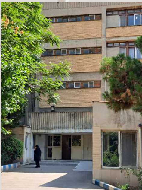
نمای ساختمان اساتید و کتابخانه