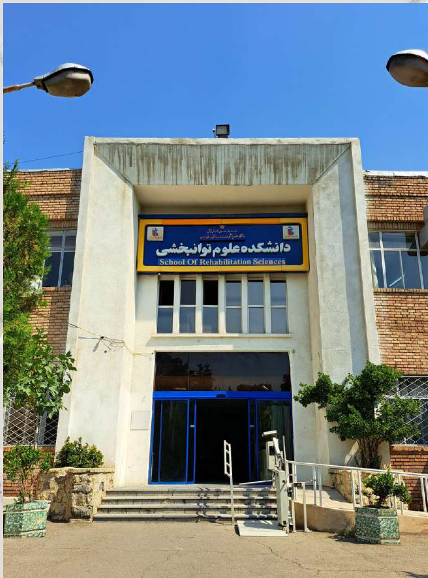
نمای ساختمان اصلی

این ساختمان چند بخش داره اول از همه دپارتمان رشته ها و کلینیک هاست ( پ.ن دپارتمان و کلینیک رشته ارتوز پروتز اینجا نیست و تو حیاط دانشکده و پشت باشگاه ورزشیه؛ پس حواستون باشه آگه روزی کارتون به دپارتمان ارتوز پروتز افتاد، تو حیاط دنبالش باشید به جای ساختمان اصلی!) داشتم میگفتم؛ با وارد شدن به ساختمان اصلی، دو راهی ای دیده میشه که گویی دو قطب و سرزمین متفاوتن. هر چی کلینیک اپتومتری و شنوایی از طراحی و دکوراسیون مدرن برخوردارن، سایر کلینیک ها انگار که در حقیقت کم لطفی شده و رنگ و رویی قدیمی دارن! سمت راست شامل کاردرمانی، فیزیوتراپی و بخشی که با پله جدا شده و به طبقه بالا می ره، کلینیک گفتاردرمانیه. سمت چپ، ساختمان کلینیک شنوایی و نمازخانه ست و پله هایی که به سمت طبقه دوم می رن؛ هنگام بالا رفتن، اول از همه در پاگرد اول دفتر بسیج رو میبینیم و بعد از اون با گذشتن از پله های بعدی به کلینیک اپتومتری می رسیم و در ادامه ی همین مسیر، سالن آزادی و کلاسای تحصیلات تکمیلی و نهایتاً دفتر ریاست دانشکده به چشم میخوره.