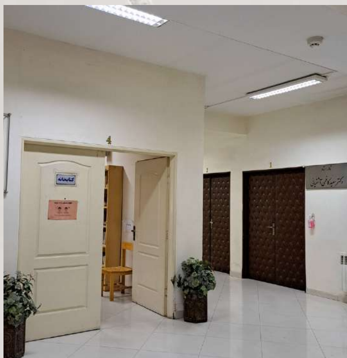
سالن شهید آشتیانی