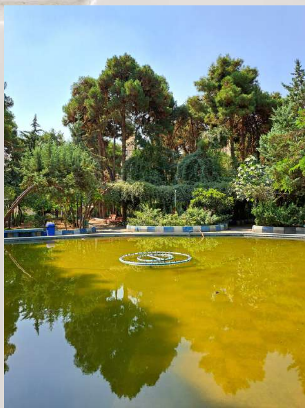
حوض شش ضلعی دانشکده