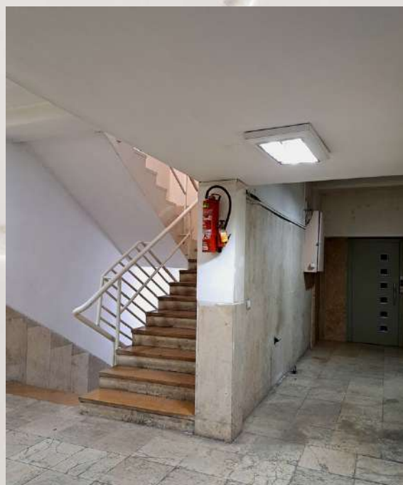
نمایی از محوطه داخلی ساختمان ابن سینا