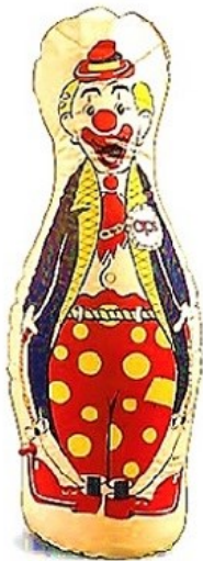
A Bobo Doll